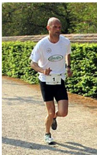
Mit Startnummer 1 der laufende Bürgermeister - insgesamt Platz sechs