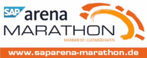
Banner anklicken - informieren LaufReport Info zum Mannheim Marathon HIER