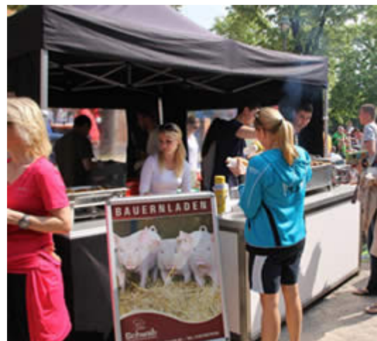
Würstchen aus artgerechter Tierhaltung vom Bauernladen Schwab

Apropos Siegerehrung: Die Schwetzingen Geschäftswelt spendet auch diese Jahr wieder wertvolle Sachpreise. Nicht nur die schnellsten Läufer gehen mit vollen Händen nach Hause, auch in der Tombola warteten 120 Preise auf Abholung. Zudem werden fünf Hauptpreise, darunter ein 1000-Euro-Fahrrad, verlost. Und wer freut sich noch? Das Transponder-Pfandgeld konnte auch gespendet werden. Dies sowie weiterer Überschuss aus den Verkäufen kommt dem Tierschutzverein für die Einrichtung eines Katzenhauses zu Gute.