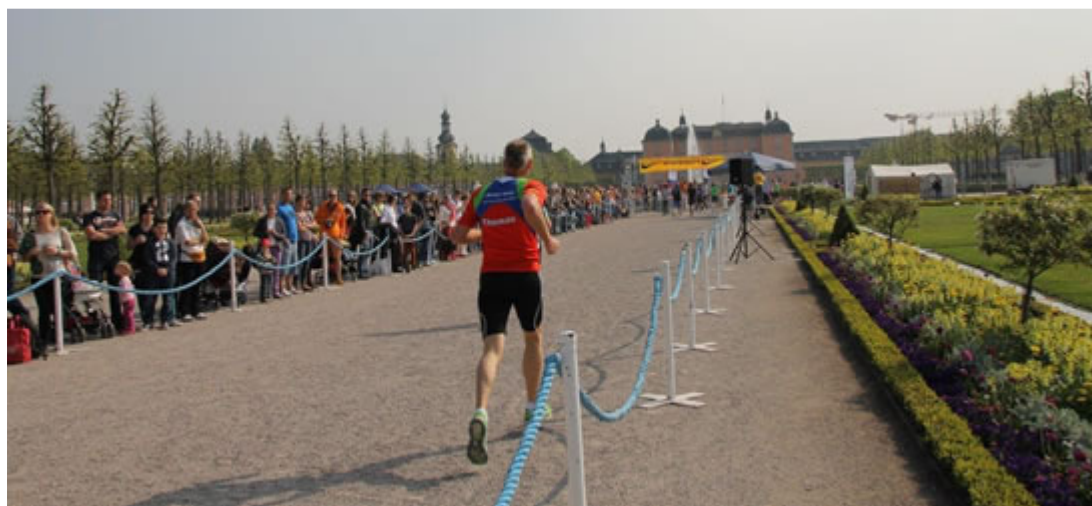
Davon schwärmen die Läufer - der Zeileinlauf auf das Schloss zu