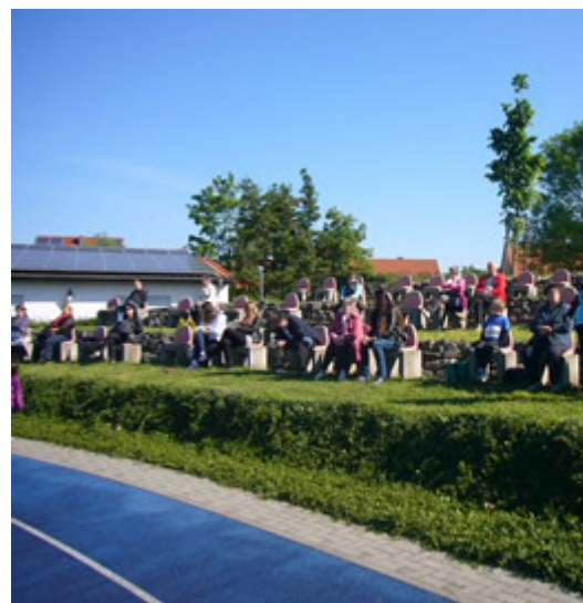
Entspannte Einzel-Sitzplätze im Stadion de