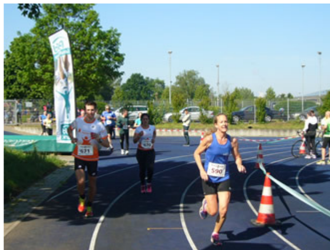
...die auf dunkelblauen Tartan verlaufen