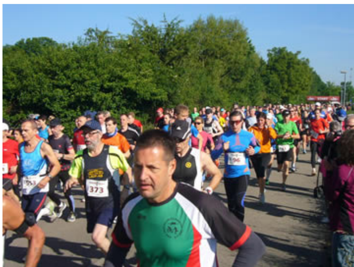
Lange dauert es, bis die gesamte Läufer Schlange auf der Strecke war