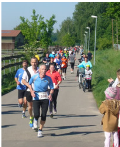
Die letzte Gerade, bevor es für alle Läufer ins Stadion auf die verbleibenden, wenigen Meter geht...